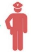
จนท.พัสดุ

-เจ้าหน้าที่พัสดุรับใบเบิกที่ได้รับอนุมัติ -จัดเตรียมพัสดุตามรายการที่ได้รับอนุมัติ -จ่ายวัสดุให้กับผู้ขอเบิก -ผู้รับตรวจสอบความครบถ้วนของพัสดุที่ขอเบิก -เจ้าหน้าที่พัสดุดัดรายการวัสดุที่ขอเบิกออกจากรายการในบัญชี