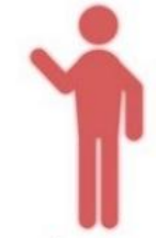
ผู้ยื่นขอเบิก