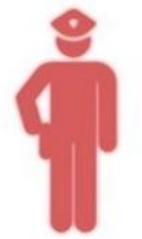
ผู้กำกับการ

-ผู้กำกับการ (หัวหน้าหน่วยงาน) พิจารณาเหตุผลและความจำเป็นในการเบิก 1. อนุมัติให้เบิกจ่าย 2. ไม่ อนุมัติให้เบิกจ่าย (นำใบเบิกกลับไปแก้ไขใหม่)